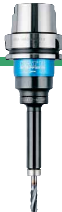
HSK-A63-SKB412 + TCA412-M-HP-SB

※ ☆ の型式は受注生産のため納品までに時間がかかる場合があります。ご了承下さい。 ※L0寸法は、TCA-S型装着時のものです。その他は(L1+H1)にて算出下さい。(P19参照) ※マニュアルクランプ穴付HSKシャンクは特別注文品です。