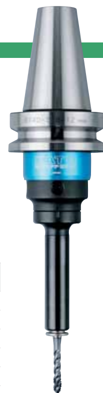
BT40-SKB412 + TCA412-M

※ ☆ の型式は受注生産のため納品までに時間がかかる場合があります。ご了承下さい。 ※L0寸法は、TCA-S型装着時のものです。その他は(L1+H1)にて算出下さい。(P19参照)