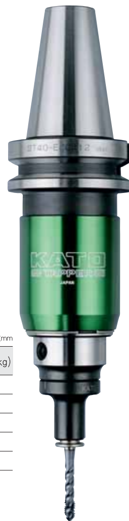
BT40-ECG412 + TCA412-S