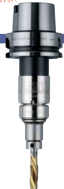
HSK-A63-HA412-M-OHC + TC412-MO-SB