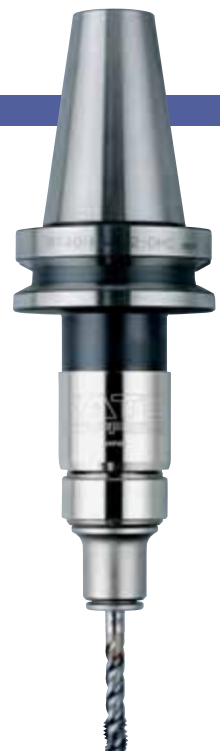
BT40-HA412-M-OHC + TC412-MO