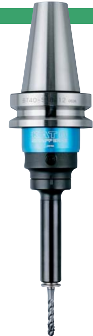
BT40-SKB412 + TCA412-M