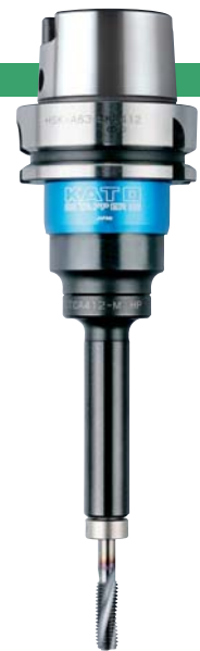
HSK-A63-SKB412 + TCA412-M-HP-SB