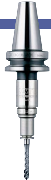
BT30-HA206-M + TC206-M

model DBT-HA-M-OHC (DBT shank : BT shank with flange contact surface)