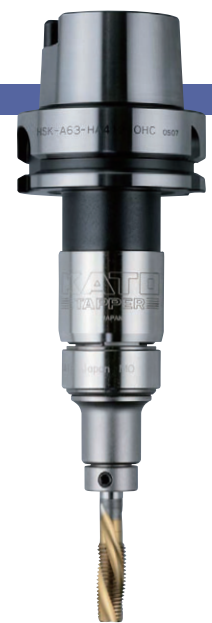
HSK-A63-HA412-M-OHC + TC412-MO-SB

※以 ☆ 标记的型号为接单生产, 交货期可能会延长, 敬请谅解。 ※带孔的手动夹紧 HSK 刀柄可特别订购。