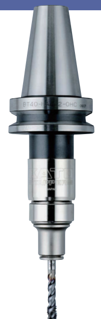
BT40-HA412-M-OHC + TC412-MO