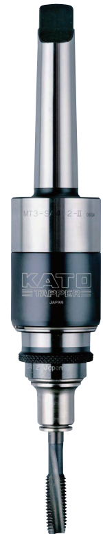
MT3-SA412-II + TC412