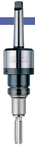
MT3-RA1022 + TC1022