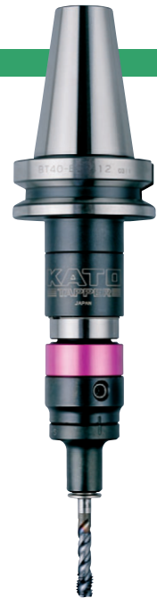
BT40-ECP412 + TCA412-S

※L0 should only be considered for model TCA-S. When using other models, L0 should be calculated as L1+H1. (cf. P09)