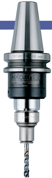
BT40-RA412-M + TC412-MO