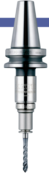
BT30-HA206-M + TC206-M