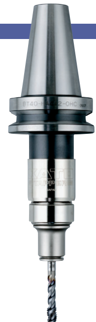
BT40-HA412-M-OHC + TC412-MO

※☆의 형식은 수주 생산이기 때문에 납기까지 시간이 걸리는 경우가 있습니다. ※Models marked with ☆ may require a longer delivery term because they are based on per-order production.