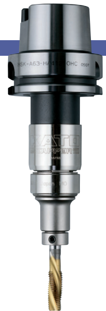
HSK-A63-HA412-M-OHC + TC412-MO-SB

※☆의 형식은 수주 생산이기 때문에 납기까지 시간이 걸리는 경우가 있습니다. ※수동클램프 구멍이 있는 HSK 샹크는 특별 주문품입니다. ※Models marked with ☆ may require a longer delivery term because they are based on per-order production. ※HSK shank with holes for manual clamping is available as a special order.