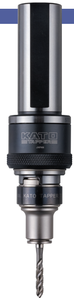
STT32-SA412-VI + TC412

※ ☆의 형식은 수주 생산이기 때문에 납기까지 시간이 걸리는 경우가 있습니다. ※ Models marked with ☆ may require a longer delivery term because they are based on per-order production.