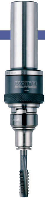
ST32-SA412-VI + TC412

※ ☆의 형식은 수주 생산이기 때문에 납기까지 시간이 걸리는 경우가 있습니다. ※ Models marked with ☆ may require a longer delivery term because they are based on per-order production.