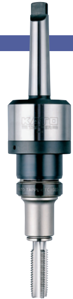
MT3-RA1022 + TC1022