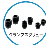
クランプスクリュー