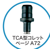
TCA型コレット ページ A72