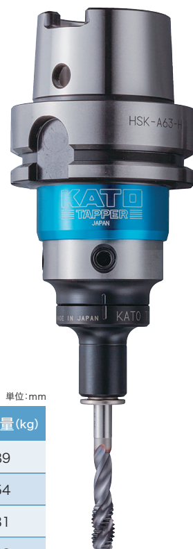
HSK-A63-H-SKB412 + TCA412-S