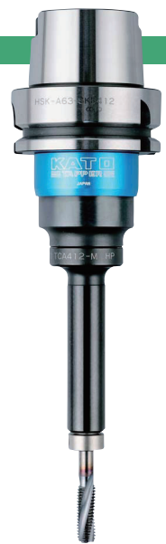
HSK-A63-SKB412 + TCA412-M-HP-SB

※以 ☆ 标记的型号为接单生产, 交货期可能会延长, 敬请谅解。 ※L0 尺寸应考虑使用 TCA-S 型, 使用其他型号时, L0 尺寸应由 L1+H1 计算得出。(参考 P09) ※带孔的手动夹紧 HSK 刀柄可特别订购。