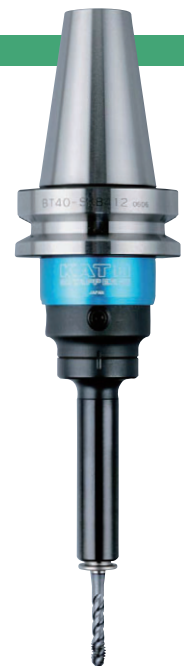
BT40-SKB412 + TCA412-M

※以 ☆ 标记的型号为接单生产, 交货期可能会延长, 敬请谅解。 ※L0 尺寸应考虑使用 TCA-S 型, 使用其他型号时, L0 尺寸应由 L1+H1 计算得出。(参考 P09)